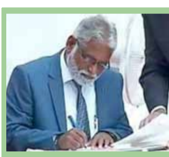
ನಂತರ ಪತ್ರಕರ್ತರೊಂದಿಗೆ ಮಾತನಾಡಿದ ಅವರು, ಕೊಳ್ಳೇಗಾಲದ ತಮ್ಮ ಕ್ಷೇತ್ರದ ಕಡೆಗೆ ಹಾಗೂ ಮುಂಬರುವ ಲೋಕಸಭಾ ಚುನಾವಣೆ ಹಿನ್ನೆಲೆಯಲ್ಲಿ ಪಕ್ಷ ಬಲಪಡಿಸುವ ಬಗ್ಗೆ ಗಮನ ಹರಿಸುವುದಾಗಿ ಹೇಳಿದ್ದಾರೆ. ನಾನು ಬೆಂಗಳೂರಿನಲ್ಲೇ ರಾಜೀನಾಮೆ ಯನ್ನು (2ನೇ ಪುಟಕ್ಕೆ)