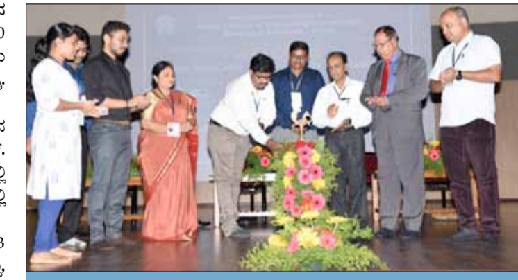
ಬಿಬಿಇಟಿಯಲ್ಲಿ ಹ್ಯಾಕಥಾನ್ ಕಾರ್ಯಕ್ರಮ